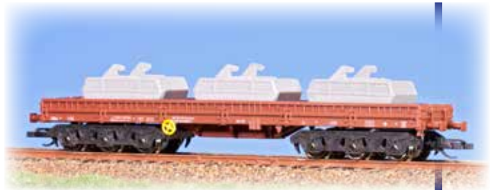
Niederbordwagen Samm mit 3 Behältern 20360 mit 3 Wechselbehältern, Betriebsnummer 486-0830

TT 1:120 DR IV NEM 94 (← →) NEM n III/17