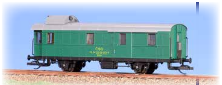
Gepäckwagen ex Pwi 31a 53100, Bestellschluss 30.06.2017 Betriebsnummer Dd 7-2288

TT 1:120 ČSD III NEM 108 (← →) NEM E (fan) Lim n IV/17