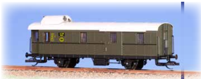
Gepäckwagen Pwi 31a 53020 Betriebsnummer Mainz 117 508

TT 1:120 ČSD III NEM 108 (← →) NEM E (fan) n Lim IV/17