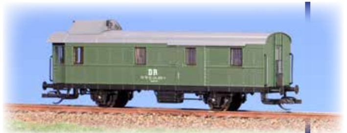
Gepäckwagen ex Pwi 31a 53010 Betriebsnummer Daai 26-234-1

TT 1:120 DR IV NEM 108 (← →) NEM E (fan) n III/17