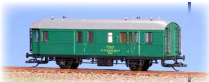
Postwagen ex. PwPosti 34a 52120, Bestellschluss 30.06.2017 Betriebsnummer F5-0679

TT 1:120 DR IV NEM 108 (← →) NEM E (fan) n III/17