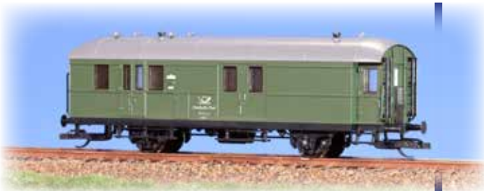
Postwagen ex PwPosti 34a 52110 Betriebsnummer Daa 09-15 388-1

TT 1:120 DR IV NEM 131 (← →) NEM n IV/17