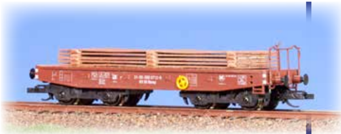
Schwerlastwagen Rlmpm mit Stahlplatten 20530 Handbremseinrichtung, Betriebsnummer 389-0712

TT 1:120 DR IV NEM 94 (← →) NEM n III/17