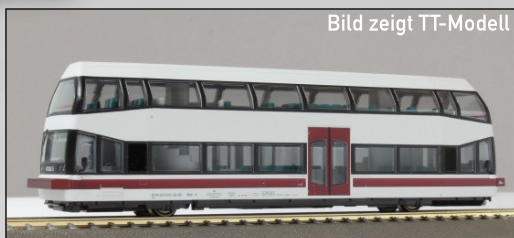
Bild zeigt TT-Modell