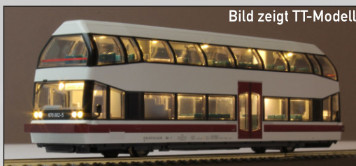
Bild zeigt TT-Modell