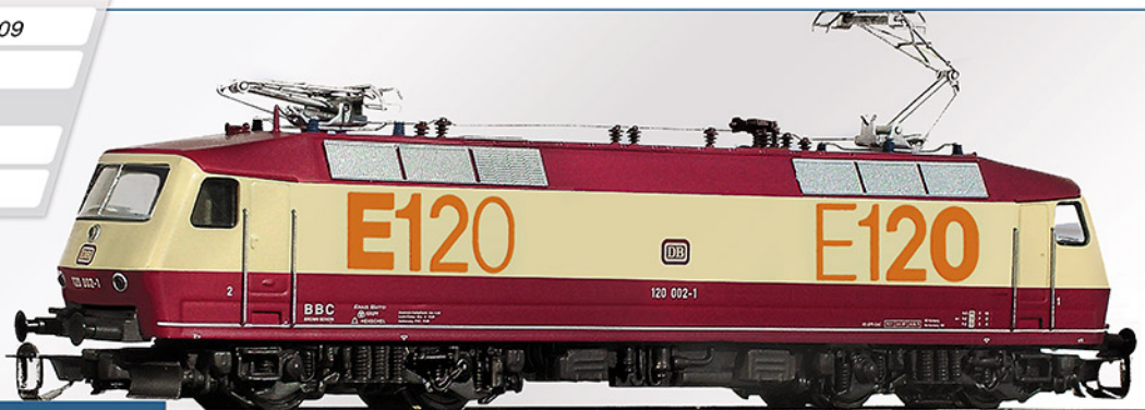
BR 120 DB, Vorserie „E120“

Unser Modell zeigt die besondere Präsentationsausführung „E120“ zur Verkehrsausstellung 1979 in München. Wir produzieren letztmalig ein Produktionslos von 50 Stück. Nur noch wenige lieferbar.