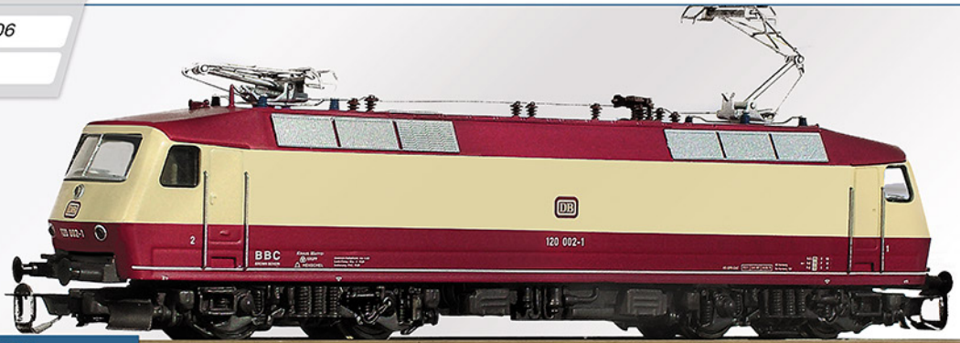
BR 120 DB, Epoche IV

Nach umfangreichen Versuchen einer neuartigen Antriebstechnik mit Drehstrom-Asynchronmotoren wurde der Nachweis erbracht, dass die Möglichkeit besteht, eine Lokomotive für alle Zuggattungen zu bauen. Daraufhin wurden fünf Vorserienlokomotiven der BR 120 bestellt.