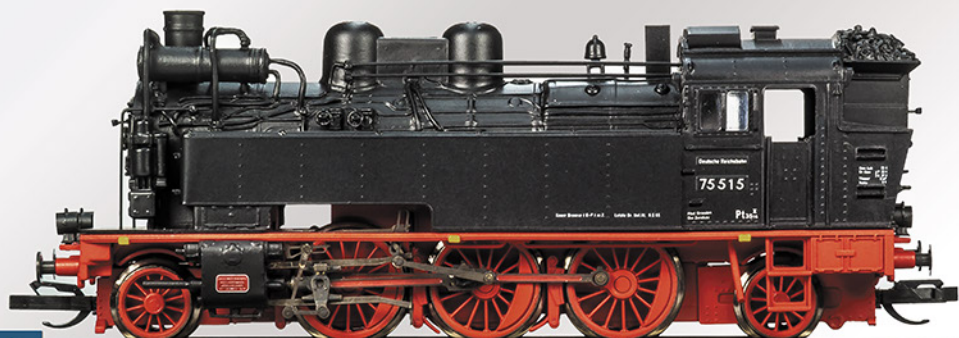
BR 75 515 Ep.III Museumslok

BR 75.5 DR, 75 510 Epoche III Rbd Dresden, Bw Werdau