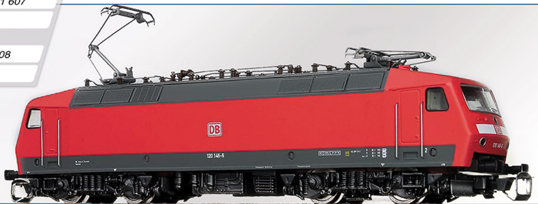
BR 120.1 DB AG Epoche Vb

Dieses Modell entspricht der Serienausführung der BR 120 im verkehrsroten Anstrich der DB AG. Der Antrieb erfolgt vom Motor über 2 Kardanwellen auf alle 4 Achsen. Das Modell besitzt wechselnde Spitzenbeleuchtung.