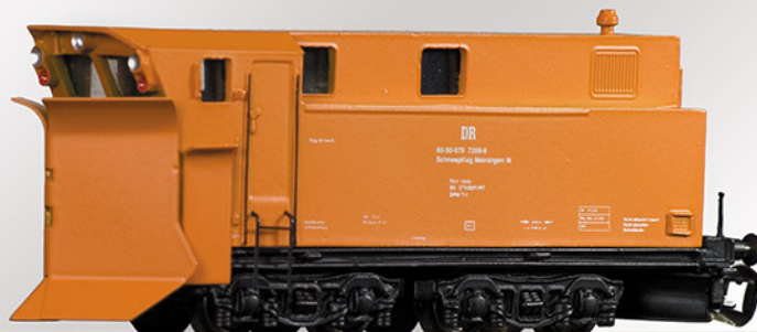
Klima-Schneepflug, DR, Bauart Meiningen

Beim Vorbild kann der Schneepflug von jeder Lokomotive bewegt werden, da der die Flügel bewegende Zylinder so dimensioniert ist, dass er sowohl mit Dampf als auch mit Druckluft gespeist werden kann.