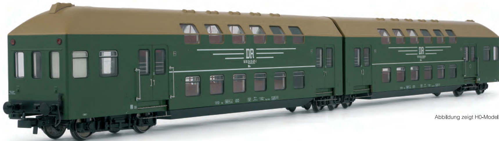
Abbildung zeigt H0-Modell

Das Modell HN9501 gibt einen zweiteiligen Doppelstockzug in dieser Farbgebung wieder. Eingesetzt war das Vorbild auf den Strecken in Thüringen.