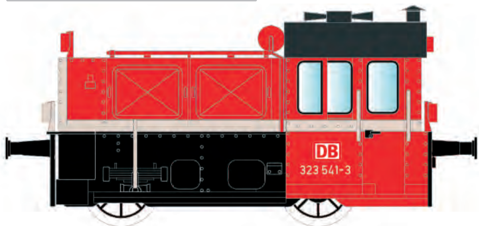
Kö II, 323 541-3, DB AG, Ep. V