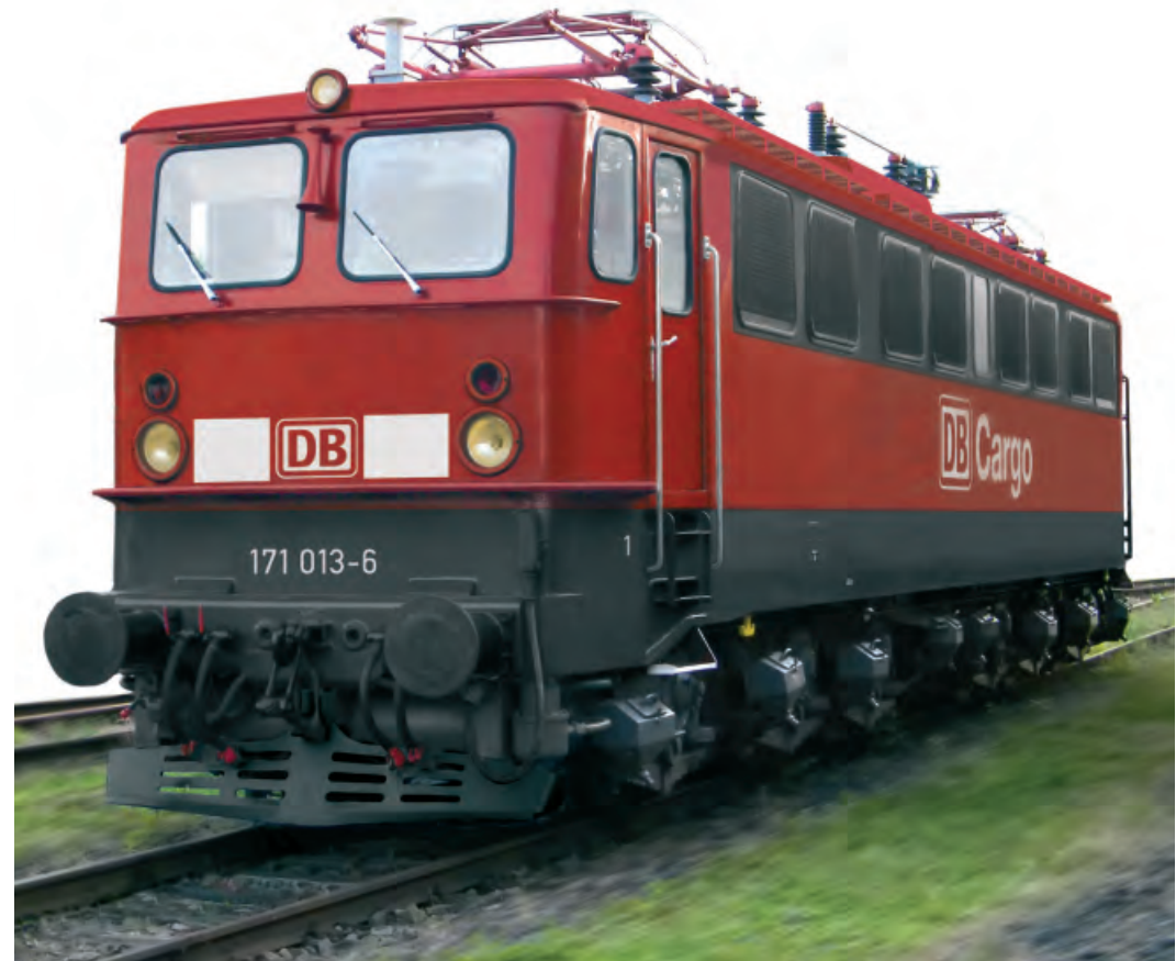
Modell der 171 013-6, Ep.V, in verkehrsroter Lackierung DB Cargo/Magdeburg