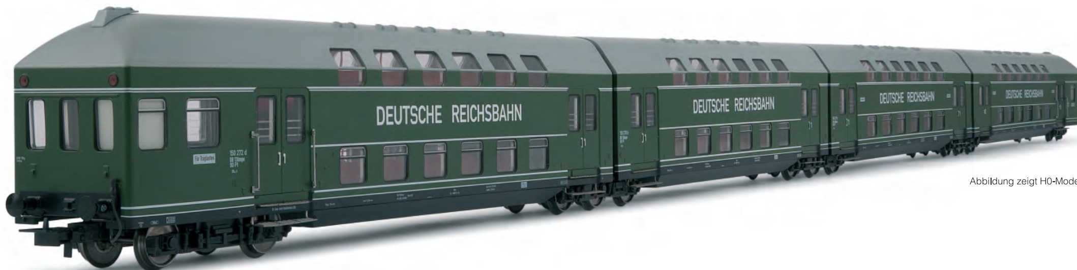
Abbildung zeigt HO-Modell

Die neuen Modelle geben die Ausführungen als 2-teilige Einheit und als 4-teilige Einheit, sowohl mit Steuerabteil als auch ohne, wieder.