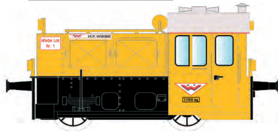
Kö II, Wiebe Lok Nr. 1, Ep. V