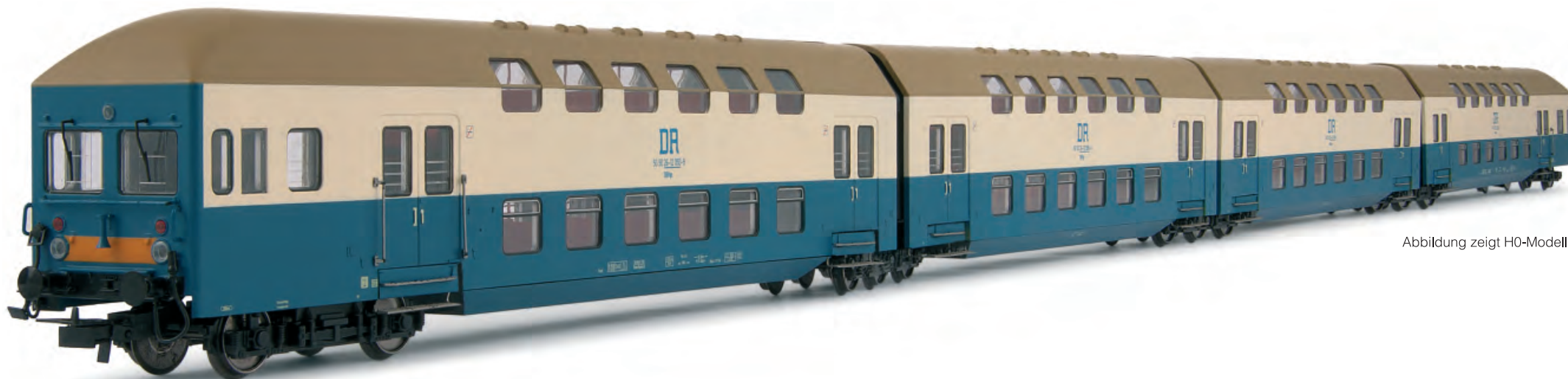
Abbildung zeigt H0-Modell

Das Modell HN9502 stellt einen vierteiligen Doppelstockgliederzug mit Steuerabteil in den Farben der Rostocker S-Bahn dar.