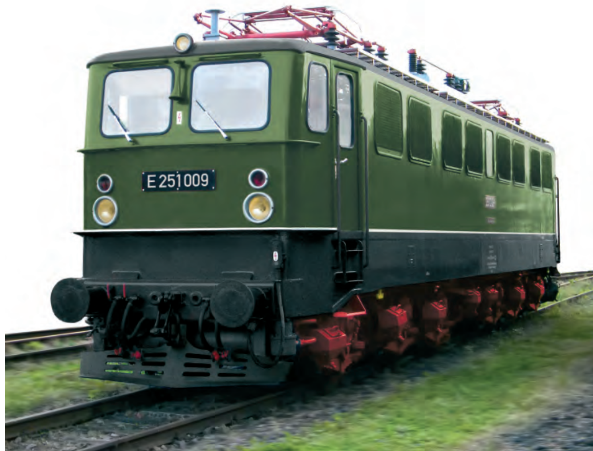
Modell der E251 009, Ep.III, in dunkelgrüner Lackierung Rbd Magdeburg/Bw Blankenburg