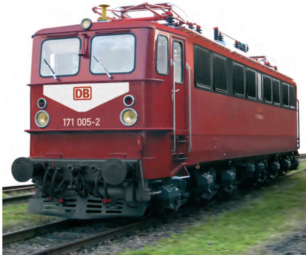
Modell der 171 005-2, Ep.V, in orientroter Lackierung DB Cargo/Halberstadt