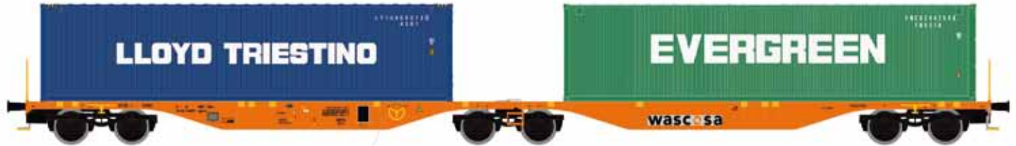
M58600 SGGMRSS 90', Wascosa orange, mit 2x 40' EVERGREEN/LLOYD UVP 65,90 €