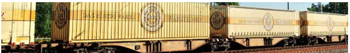
M58653 SGGMRSS 90' AAE/WLE mit 2x 43' Warsteiner UVP 65,90 €