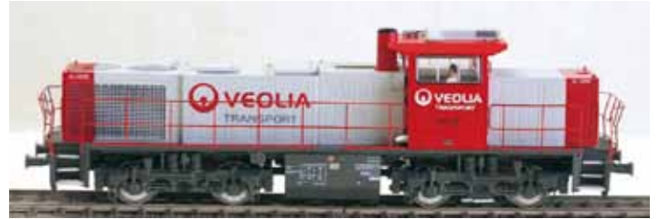
Art. 55659 G1206 Veolia 1 AC Digital UVP 114,90 € Art. 55660 G1206 Veolia 1 AC Digital Sound UVP 214,90 €