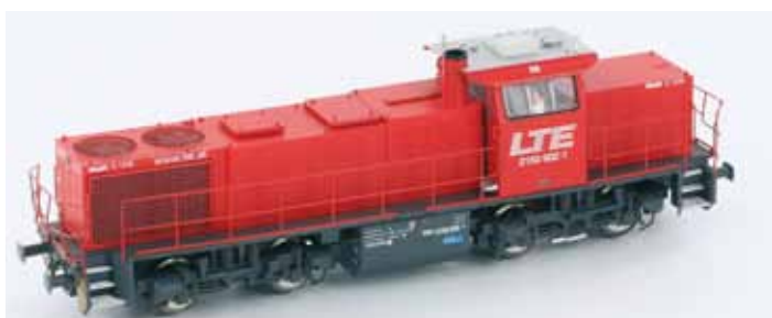
Art. 55274 G1206 LTE rot DC UVP 114,90 € Art. 55276 G1206 LTE rot AC Digital UVP 149,90 €