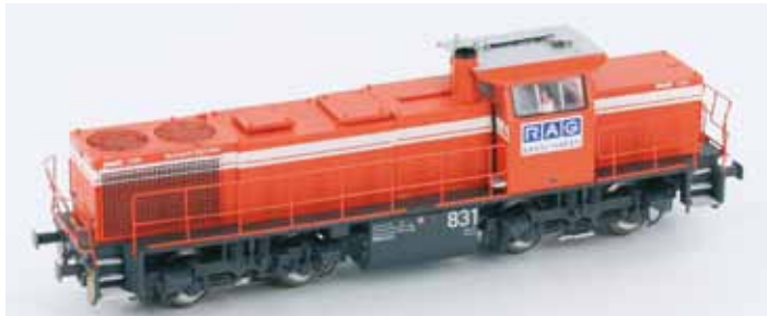
Art. 55266 G1206 RAG DC UVP 114,90 € Art. 55267 G1206 RAG DC Digital mit Sound UVP 214,90 € Art. 55268 G1206 RAG AC Digital UVP 149,90 € Art. 55269 G1206 RAG AC Digital mit Sound UVP 214,90 €