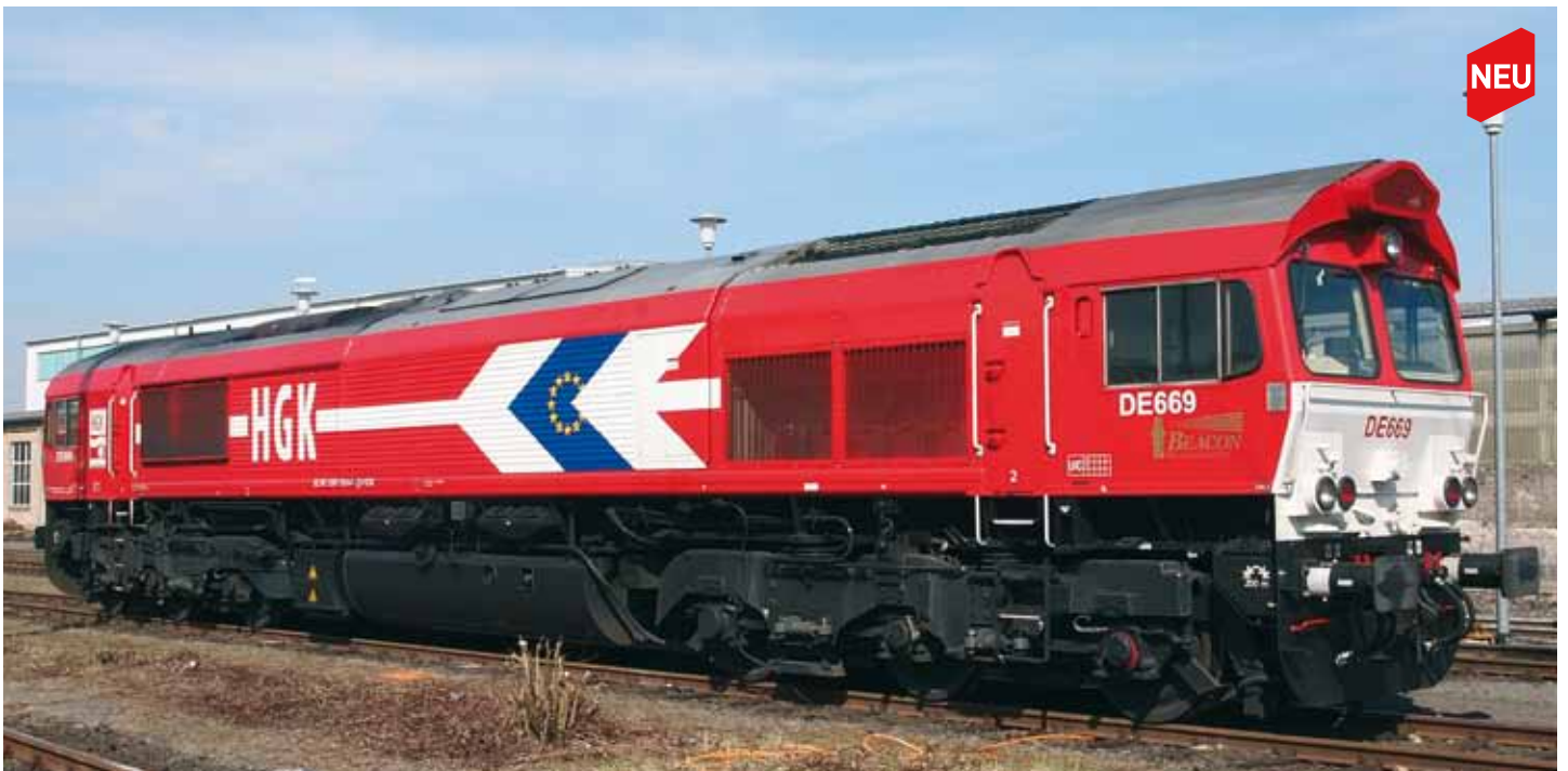
M58597 Class66 HGK DE 668 „Klaus Meschede“, DC UVP 199,90 € M58598 Class66 HGK DE 668 „Klaus Meschede“, AC-Digi UVP 219,90 €