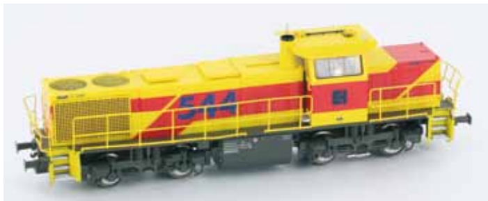
Art. 55306 G1206 E+H DC UVP 114,90 €