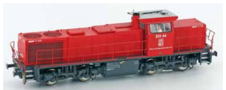
Art. 55270 G1206 HGK DC UVP 114,90 € Art. 55272 G1206 HGK AC Digital UVP 149,90 €