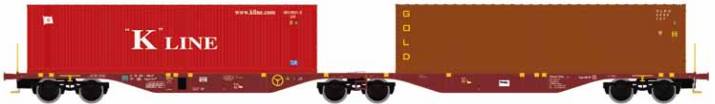
M58635 SGGMRSS 90', TOUAX braun, mit 2x 40' K-Line/GOLD UVP 65,90 €