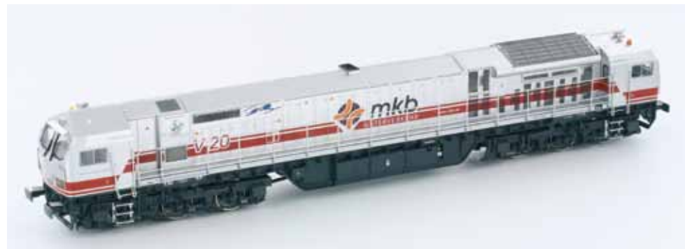
Art. 2722 Bombardier BT2 MKB UVP 139,90 € Art. 2416 gleiche AC Digital UVP 174,90 €