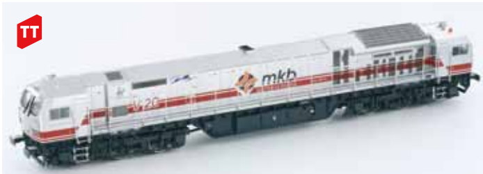
Art. 55530 Bombardier BT2 MKB UVP 169,90 € Spur TT