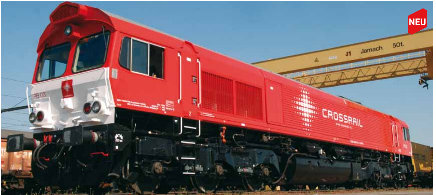
M58595 Class66 Crossrail PB03, DC UVP 199,90 € M58596 Class66 Crossrail PB03, AC-Digi UVP 219,90 €