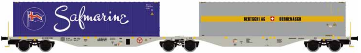
M58637 SGGMRSS 90', AAE grau, mit 2x 40' Bertschi/Safmarine UVP 65,90 €