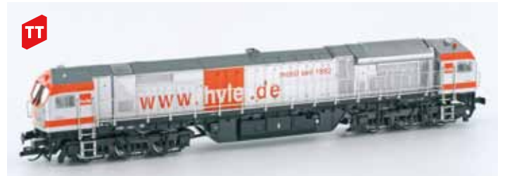
Art. 55705 Bombardier BT2 HVLE UVP 169,90 € Spur TT