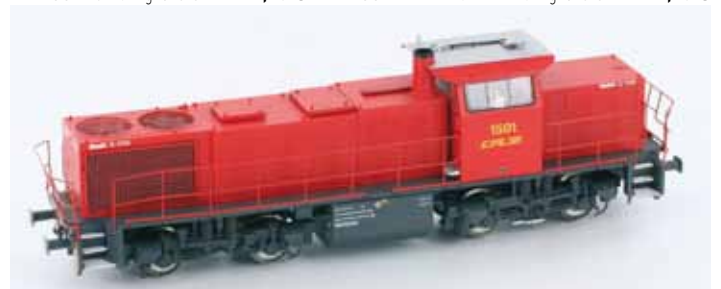
Art. 55298 G1206 DC UVP 114,90 €