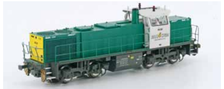
Art. 55290 G1206 RAIL4CHEM DC UVP 114,90 € Art. 55295 G1206 RAIL4CHEM Digital mit Sound UVP 214,90 € Art. 55292 AC Digital UVP 149,90 € Art. 55294 RAIL4CHEM 2 DC UVP 114,90 € Art. 55293 AC Digital S UVP 214,90 € Art. 55297 RAIL4CHEM 2 AC Digital S UVP 214,90 €