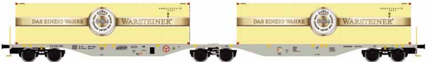
M58655 SGGMRSS 90' AAE Warsteiner mit 2x 40' Warsteiner UVP 65,90 €