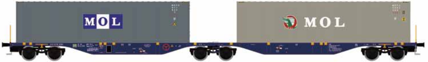
M58599 SGGMRSS 90', ERR blau, mit 2x 40' MOL UVP 65,90 €

Der flexible Wagen eignet sich ausgezeichnet für die Ladung von fast allen Containerarten sowie Wechselbehältern von 13,6 m Länge. Der Wagen wird von zahlreichen Transportunternehmen in ganz Europa verwendet. Das Ladegewicht von 106 t ist bei diesem Wagentyp ausgesprochen hoch.