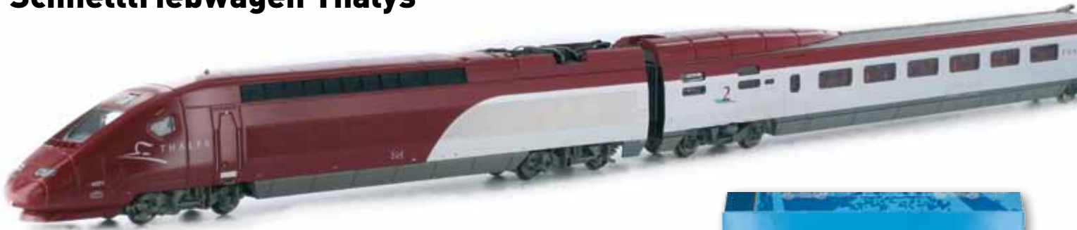
Art. 29712 4-tlg Set Thalys PBKA „Hobby“ DC UVP 119,90 €