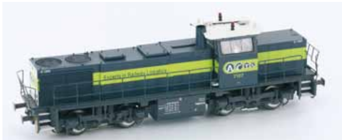
Art. 55282 ACTS 7107 DC UVP 114,90 € Art. 55284 ACTS 7107 AC Digital UVP 149,90 € Art. 55285 ACTS 7107 AC Digital mit Sound UVP 214,90 €