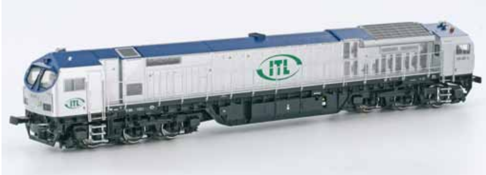
Art. 5012 Bombardier BT2 ITL UVP 139,90 € Art. 2419 gleiche nur AC Digital UVP 174,90 €