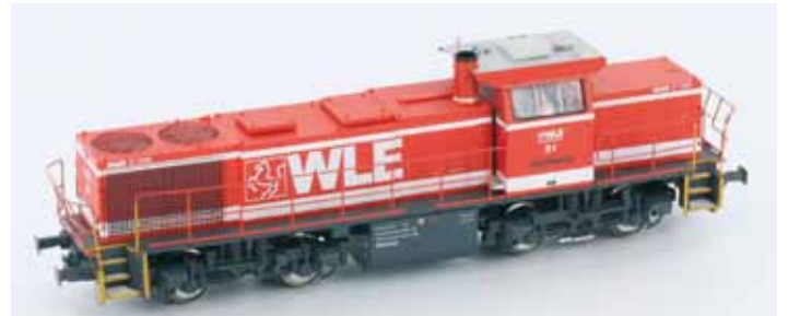
Art. 55262 G1206 WLE DC UVP 114,90 €